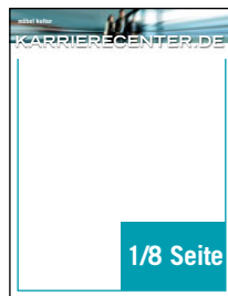
104 mm x 70 mm 557,20 €