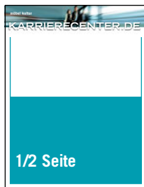
212 mm x 140 mm 2.228,80 €